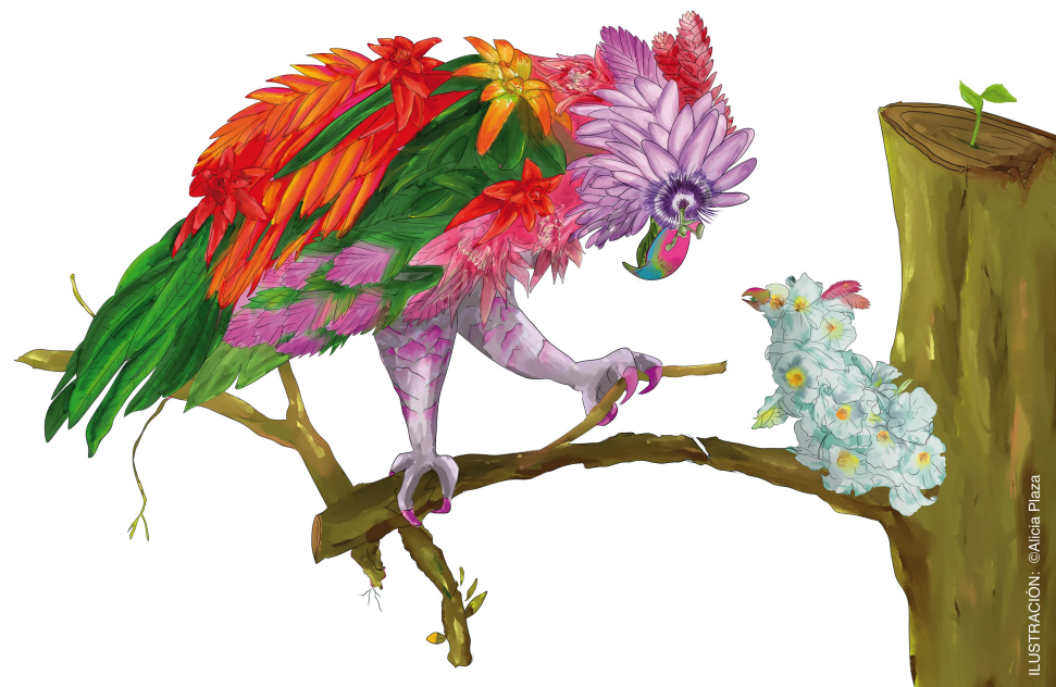
ILUSTRACIÓN: © Alicia Plaza